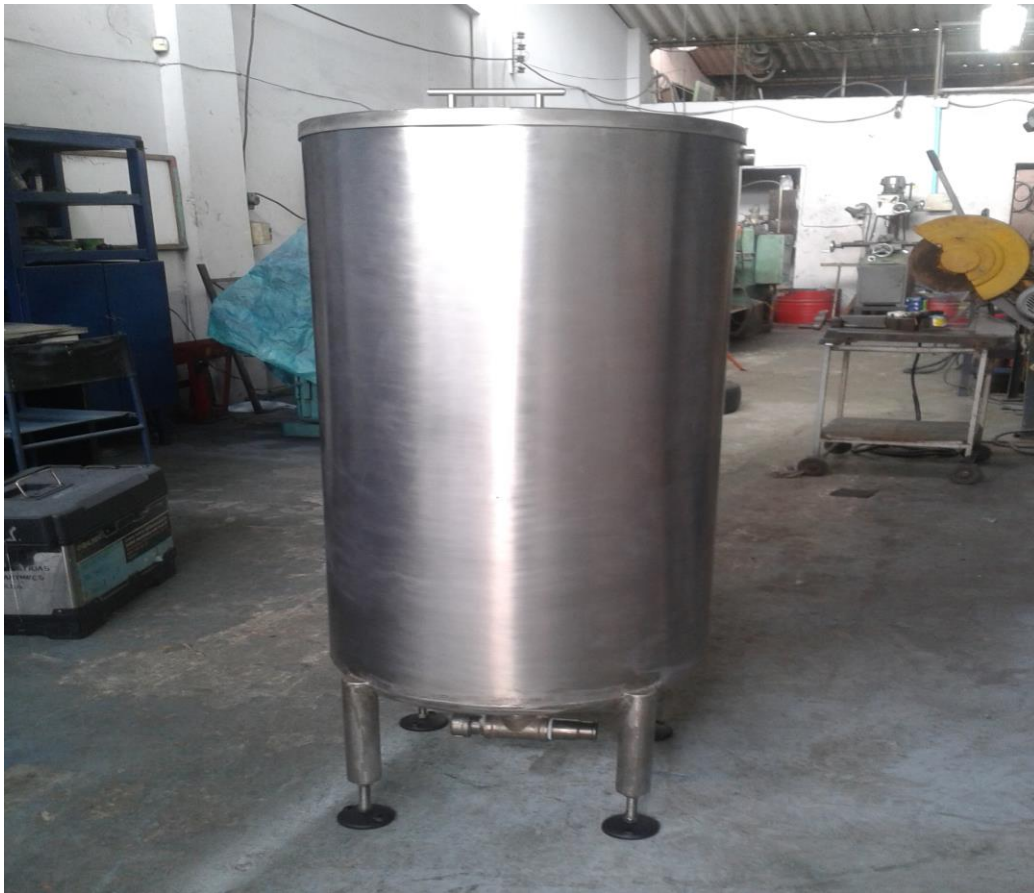
Figura # 1. Tanque en acero inoxidable fabricado para Salsan Ltda.