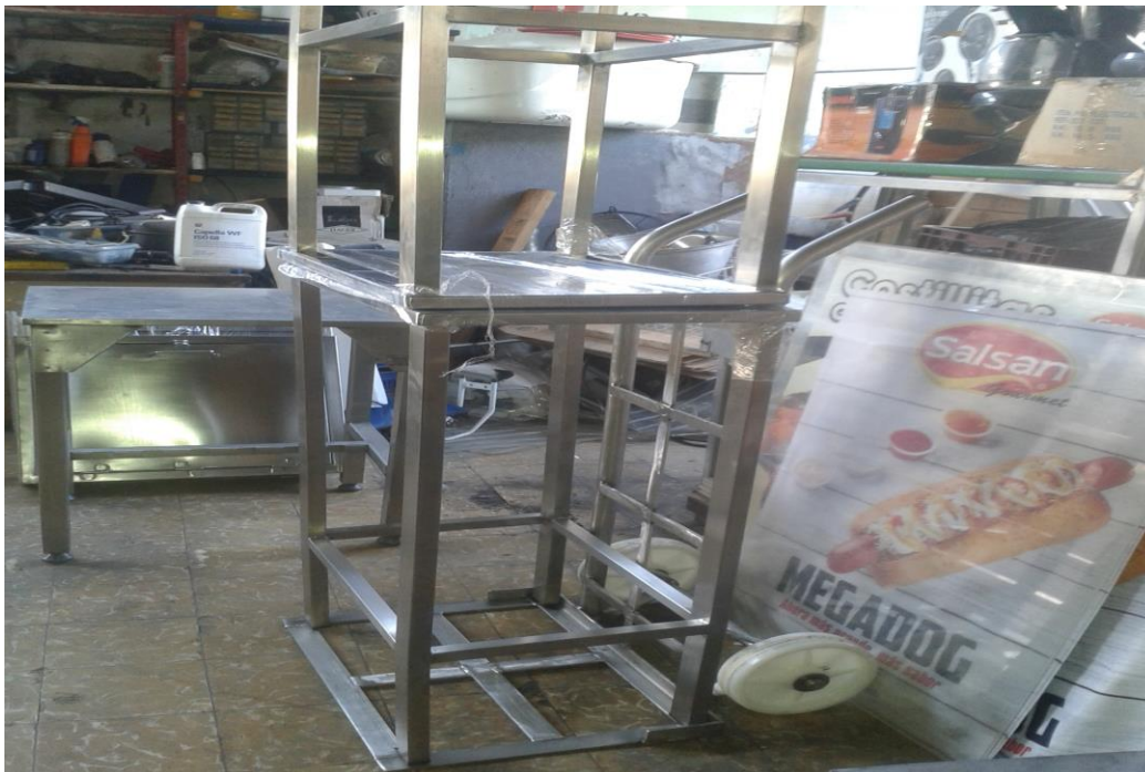
Figura #2. Mesas y "zorra" en acero inoxidable fabricadas para Salsan S.A.