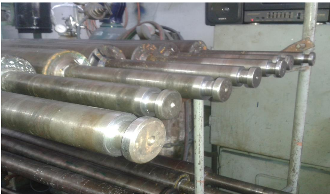
Figura #5. Mecanizado de ejes para impresora en Pronalplast Ltda.