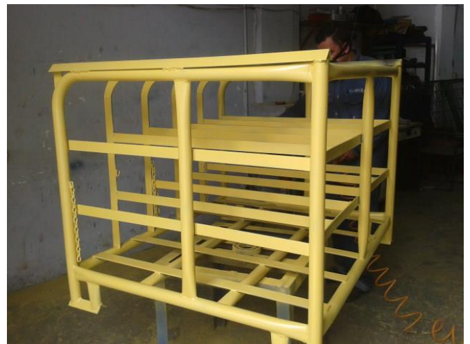
Figura # 4. Fabricamos Racks para cilindros de CO2 Coca Cola