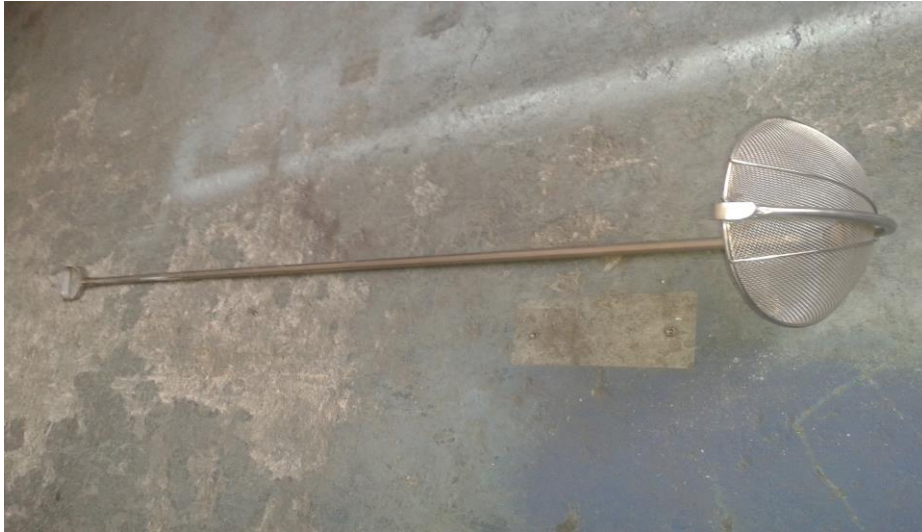
Figura 3. Fabricación de Cesta en acero inoxidable para Salsan